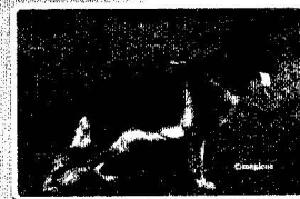
BSZS 2015 GHKL Hündin V6 Tosca d'Ulmental