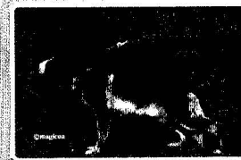
BSZS 2015 JHKL Rüden SG14 Hugo vom Radhaus