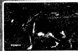
BSZS 2015 Junghundklasse Hündin SG 13 Fanny d'Ulmental