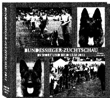
Bundessieger-Zuchtschau in Wort und Bild Ulm 2012

Die 19 Jahrbücher Bundessieger-Zuchtschau in Wort und Bild informieren über alle Hunden, die an den Siegerschauen 1994 - 2012 teilgenommen haben. In den Büchern sind total 10 400 Seiten mit etwa 21 200 Bildern!