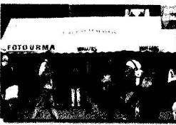
FOTO URMA Tel: +49 532 201 51 Fax: +49 532 201 70 Handy: 0174 301 09 77 Handy: +49 170 89 20 155 www.fotourma.com info@fotourma.com

Wir freuen uns über Ihren Besuch an unserem Informationsstand!