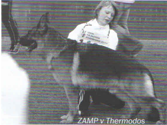
ZAMP v Thermodos

Po prostu wstyd. Bardzo duży wstyd. Wasz wstyd Panie i Panowie z Poznania. Bo to Wasz Oddział ZKwP odpowiadał za wszystko.