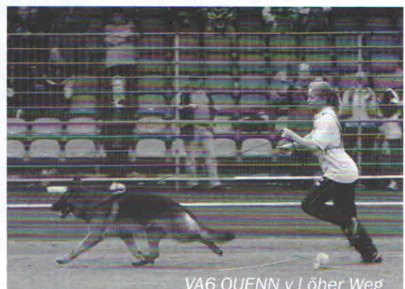
VA6 QUENN v Löher Weg