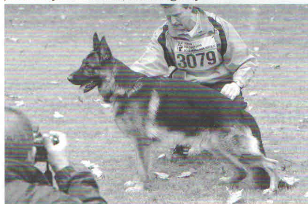
Sirio z dużą ilością czerni