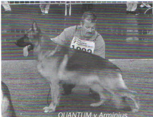
QUANTUM v Arminius

Zwycięzcą został syn przed ojcem. Olbrzymia dominacja jednej linii hodowlanej, co do której ja osobiście mam poważne zastrzeżenia. Ale czas pokaże. Trzecim był został pies, co do którego siły genetycznej słyszałem duże zastrzeżenia, szczególnie wśród baczących obserwatorów grup potomstwa. Tuż za podium dwóch reprezentantów „reszty świata” i na 6-tym miejscu „czarny koń”. Według mnie pies z dużą przyszłością. O