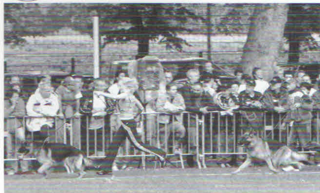
Tu widzimy jak musi wyhamować by uniknąć zderzenia. Już z respektem przygląda się przewodnikowi przed nim.