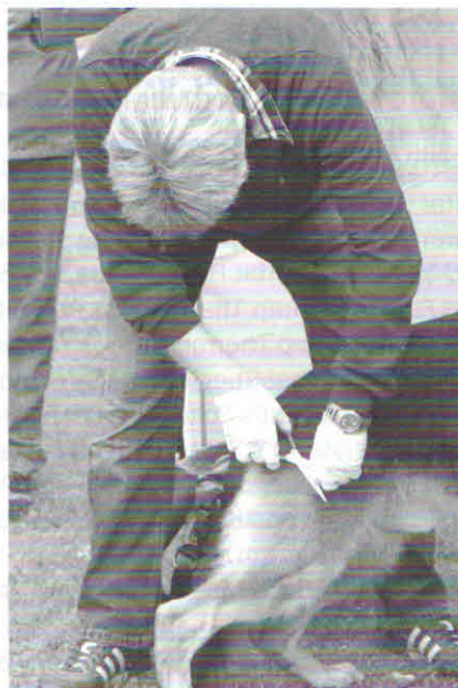
Widzimy moment, gdy ringowy pobiera próbkę włosów do kontroli DNA i farbowania. W tym roku każdy z wystawców został uprzedzony o konsekwencjach farbowania psów.