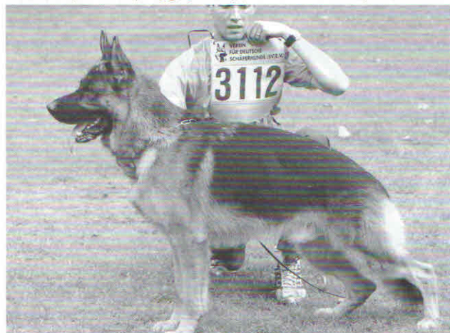
To Greif o bardzo silnej głowie. Orbit generalnie przekazuje takie silne, mocne głowy