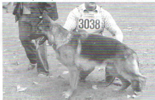
Cito Klary Buratowej, która kilkakrotnie w Polsce wystawiała psy