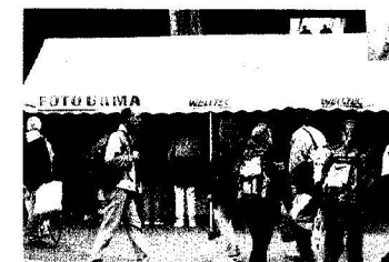
FOTO URMA S-662 98 Tösse Tel +46-532 201 55 Fax +46-532 201 70 Handy 0174 301 09 77 Handy +46-708920155 www.fotourma.com

Wir freuen uns über Ihren Besuch an unserem Informationsstand.