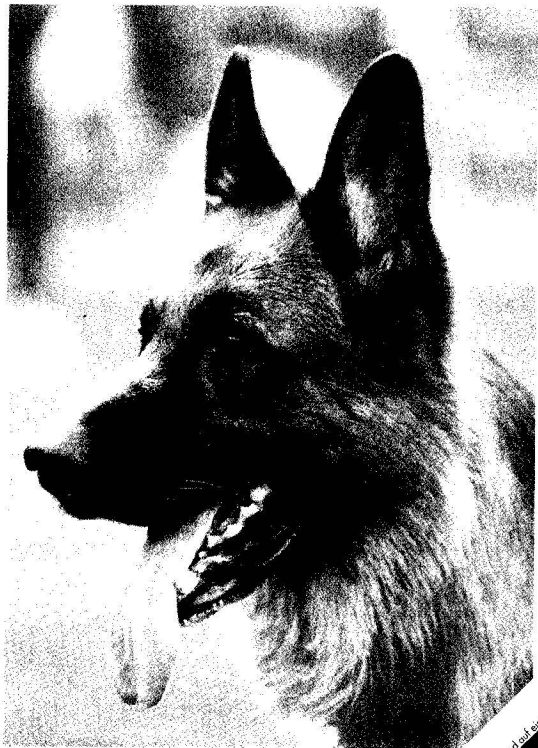
DER HUND monatlich 3 00 DM

S T N G Z H V P E Bitte ausfüllen und mit dem Praktikum abgeben. Senden Sie mir ein kostenloses Probekempler. DER HUND Deutscher Löwenverlag GmbH Werbung & Marketing Reinholdstr. 4 D-1040 Berlin PF 130