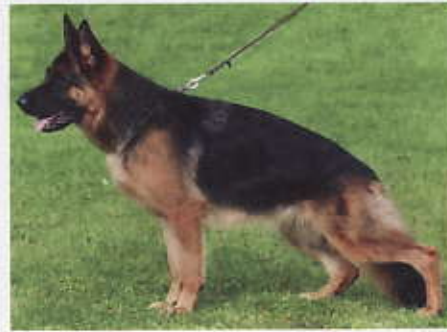
Gusteli vom Hühnegrab, 2241466, Z: Heinz Scheerer, 56357 Geisig, E: Naci Izmirliglu, 56218 Mülheim-Kärlich

18 Dana vom Elzmündungsraum, SZ 2234957, M-F 8860, WT 01.04.2009 (*Furbo degli Achei, SZ 2213251, SchH3 IP2 - *Nora vom Elzmündungsraum, SZ 2185160, SchH2) HD normal, DNA gpr., ED normal. Groß, kraft- und gehaltvoll, knochenkräftig, sehr guter Kopf, Typ und Ausdruck, etwas gestreckt, sehr gutes Verhältnis von Widerristhöhe zu Laufknochen, hoher Widerrist, fester Rücken und gute Kruppe, sehr gute Winkelungen, ausgeprägte Brustverhältnisse mit harmonischer Unterlinie, gerade Front, geradetretend, feste Sprunggelenke, dynamische Gänge mit kraftvollem Nachschub und betont freiem Vortritt. Eine Furbo Tochter, ohne Inzucht. Zuchtwert 75.