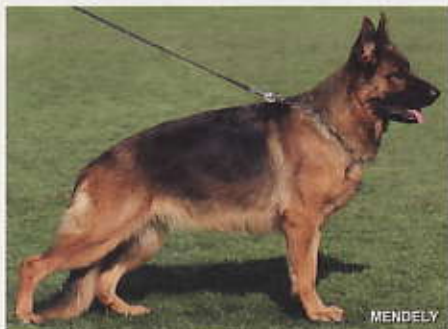
Baffie von der Kupferhölde, 2233695, Z u. E: Walter Bickel, 75015 Bretten

25 Kaleya vom Amur, SZ 2239647, F-A 4986, WT 15.06.2009 (*Paer vom Hasenborn, SZ 2194208, SchH3 - *Winona vom Amur, SZ 2080771, SchH3) HD normal, DNA gpr., ED normal. Übermittelgroß, typ- und ausdrucksvoll, kraft- und gehaltvoll, sehr guter Kopf, sehr gut pigmentiert, sehr gute Oberlinie, hoher Widerrist, fester Rücken, gut gelagerte, etwas kurze Kruppe, sehr gute Winkelungen, ausgeprägte Brustverhältnisse, gerade Front, hinten etwas eng tretend, Sprunggelenke nicht vollkommen geschlossen, vorne gerader Gang mit fest anliegenden Ellenbogen, sehr gute Gänge, die jedoch im Laufe der Gangwerksprobe etwas an Kraft verlieren und dadurch eine ursprünglich vorgesehene höhere Platzierung nicht zuließen.