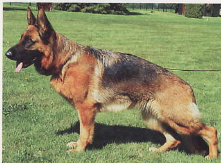
*Oilyly Blue-Iris, 2211248, Z u E: Sabine Nelde, 63543 Neuberg

29 *Oilyly Blue-Iris, SZ 2211248, L-E 3851, SchH3, WT 04.12.2007 (*Quantum vom Fiemerack, SZ 2146848, SchH3 - *Gabana Blue-Iris, SZ 2178189, SchH1) HD normal, DNA gpr., ED normal, HD-Zuchtwert 79. Groß, mittelkräftig, sehr guter Typ, kräftiger Kopf, gutes Verhältnis, hoher Widerist, gerader Rücken, bei guter Lage sollte die Kruppe länger sein, sehr gute Winkelungen und Brustverhältnisse, gerade Front. Hinten und vorne gerade tretend zeigt sie kraftvolle Gänge, wobei sie sich noch etwas konzentrierter präsentieren sollte.