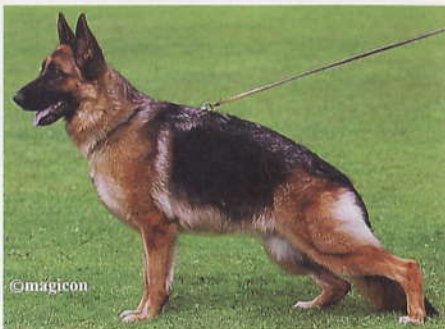
*Musa di Ca'San Marco, LOI 09/13172, Z: Franco Dolci, I-20059 Vimercate (MI), E: Sari Nohe, 68519 Viernheim, Halter: Giorgio Dolci, I-20059 Vimercate (MI)

1 *Musa di Ca'San Marco, LOI 09/13172, 8DO54, SchH2, WT 26.03.2008 (*Hannibal vom Stieglerhof, SZ 2115539, SchH3 FH1 - *Riva vom Riedschlurgi, SZ 2181670, SchH1) HD Italien, DNA gpr., ED normal Italien, HD-Zuchtwert 90. Große, mittelkräftige, in sehr gutem Verhältnis aufgebaute Hündin mit sehr gutem Typ und Ausdruck. Sie hat hohen Widerrist, festen Rücken und eine Kruppe von guter Länge und Lage. Die Vorhand ist gut und die Hinterhand ist sehr gut gewinkelt. Die Brustverhältnisse sind korrekt, die Front ist gerade. Hinten und vorne zeigt sie gerade Schrittfolge. Das Gangwerk ist weit ausgreifend und sehr raumgewinnend mit freiem Vortritt. Während der Gangwerksprobe sollte sie sich noch etwas kon-