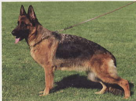
*Sari von der Freiheit Westerholt, 2190048, Z u. E: Ralf Lang, 37688 Beverungen

6 *Uschi zum Turmacker, SZ 2182078, R-A 0324, SchH2 , WT 20.05.2006 (*Losso vom Schloß Weitmar, SZ 2136850, SchH3 - *Xendy zum Turmacker, SZ 2097257, SchH1) HD normal, DNA gpr., ED normal, HD-Zuchtwert 90. Mittelgroße, mittelkräftige, typ- und ausdrucksvolle Hündin mit festem Rücken. Die Kruppe ist bei guter Lage kurz. Sie hat sehr gute Winkelungen, ausgeglichene Brustverhältnisse und eine korrekte Front. Hinten und vorne gerade tretend ist das Gangwerk dieser harmonisch aufgebauten Hündin kraftvoll. Die Hündin ist mir bereits positiv zu Beginn der Ausstellungssaison aufgefallen.