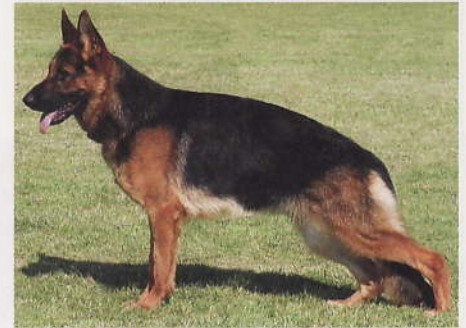
*Ilka von der Orangerie, 2203367, Z: Dr. Wolfgang Lauber, 36043 Fulda, E: Züchter und Goran Rokic, HR-34000 Pozega

Vor-, sehr gute Winkelung der Hinterhand, ausgeglichene Brustverhältnisse, gerade Front. Hinten eng, vorne geradetretend zeigt sie bei kraftvollem Nachschub mit freiem Vortritt raumgewinnende Gänge. sehr gute Gänge. Diese Hündin wurde im Vorfeld und auch bei der Siegerschau von der jugendlichen Hundeführerin bestens präsentiert.