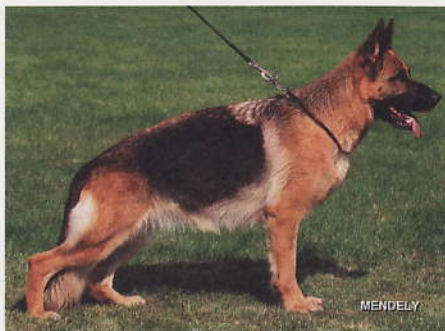
*Jana von der Plassenburg, 2183387, Z u. E: Wolfgang Haßgall, 95326 Kulmbach

10 *Lara vom Messebau, SZ 2216213, L-E 3943, SchH3, WT 12.03.2008 (*Arak de la Ferme Malgre l'eau, SZ 2199063, SchH3 - *Xenia vom Messebau, SZ 2138620, SchH2) Inz.: Yasko Farbenspiel (4-3) HD normal, DNA gpr., ED normal, HD-Zuchtwert 84. Die der Zamp-Linie entstammende Hündin konnte sich durch ihre hervorragende Gesamtverfassung und Präsenz den Platz in der V-Auslese sichern. Lara ist groß, mittelkräftig, gestreckt und sehr typvoll. Sie ist ausgesprochen trocken und fest, hat einen ausdrucksvollen Kopf, einen hohen und langen Widerrist und geraden Rücken. Die Kruppe sollte bei guter Lage eine Idee länger sein. Die Vor- und Hinterhand ist sehr gut gewinkelt, die Brustverhältnisse und die Front sind korrekt. Hinten und vorne gerade tretend zeigt sie bei kraftvollem Nachschub freien Vortritt mit guter Gleichgewichtslage. Bereits während der gesamten Ausstellungssaison fiel ihre außerordentliche Lauffreude ins Auge und ließ in Verbindung mit den guten Gebäudeverhältnissen eine hohe Platzierung erwarten.