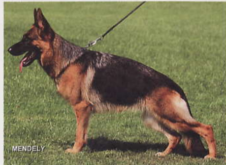
*Visa von Bad-Boll, 2180933, Z: Hans-Peter Rieker, 73101 Aichelberg, E: Renate Straub, 73087 Bad Boll

23 *Motte vom Hawelkaweg, SZ 2229350, S-C 4649, SchH2, WT 26.06.2008 (*Balko vom Gleisnauer Schloß, SZ 2146187, SchH3 - *Nikita vom Hawelkaweg, SZ 2166681, ÖPO1) HD normal, DNA gpr., ED normal, HD-Zuchtwert 82. Groß, mittelkräftig, guter Typ, hoher Widerrist und gerader Rücken. Bei guter Lage sollte die Kruppe länger sein. Sie hat sehr gute Winkelungen und Brustverhältnisse, korrekte Front. Hinten und vorne gerade tretend zeigt sie kraftvollen Nachschub und freien Vortritt.