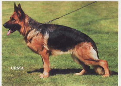
*Heaven von Rekas, 2204653, Z u. E: Reinhard Kastrup, 33334 Gütersloh

18 *Cristall della Valle del Liri, SZ 2252925, 8VLL1, SchH2, WT 20.04.2008 (*Tryp della Baia Imperiale, LOI 06/84503, SchH2 IP3 - *Ussi della Valle del Liri, LOI 04/69058, IP1) HD Italien, DNA gpr., ED normal Italien, HD-Zuchtwert 99. Die in Italien gezüchtete Hündin ist groß, mittelkräftig, typ- und ausdrucksvoll, trocken und fest. Sie hat hohen Widerrist, festen Rücken und sehr gute Länge und Lage der Kruppe. In der Vor- und Hinterhand ist sie sehr gut gewinkelt. Ausgeglichene Brustverhältnisse, die Frontlinien sind gerade. Gerade tretend zeigt sie raumschaffende Gänge. Leider ist die Hündin am Tag der Siegerschau nicht in voller Haarpracht.