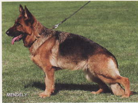
*Uschi zum Turmacker, 2182078, Z: Josef Zintl, 89350 Dürrlauingen, E: Wilhelm Kepper, 44797 Bochum

5 *Gwyneth vom Amur, SZ 2218313, D-D 2016, SchH3 IP3 , WT 20.03.2008 (*Yerom vom Haus Salihin, SZ 2165494, SchH3 FH1 - *Godalis Taira, SZ 2198914, SchH1) HD normal, DNA, ED normal, HD-Zuchtwert 75. Große, mittelkräftige, typ- und ausdrucksvolle Hündin mit sehr guter Substanz. Sie hat einen hohen Widerrist, geraden Rücken, wobei die Kruppe bei guter Lage etwas länger sein könnte. Der Oberarm ist korrekt an das Schulterblatt angelagert, die Hinterhand ist sehr gut gewinkelt, ausgeglichene Brustverhältnisse und eine korrekte Front runden das harmonische Gesamtbild ab. Hinten leicht hackeneng und vorne gerade tretend zeigt sie weit ausgreifende Gänge mit sehr gutem Raumgewinn.