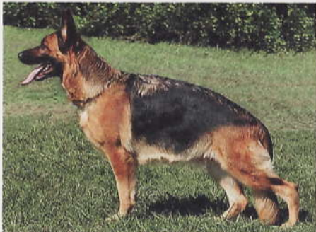
*Quickie vom Hohen-Haus, 2193458, Z: Thomas Linossi, A-5020 Salzburg, E: Giuseppe Statuto, A-5071 Wals

11 *Eviva vom Bad Wäldle, SZ 2200291, N-P 4954, SchH2, WT 12.05.2007 (*Scott aus Agrigento, SZ 2143658, SchH3 - *Tiffany von der hohen Eiche, SZ 2030525, SchH2) HD normal, DNA, ED normal, HD-Zuchtwert 83. Die Hündin ist groß, mittelkräftig, in gutem Verhältnis aufgebaut. Sie hat sehr guten Typ und Ausdruck und ist trocken und fest und hat hohen Widerrist. Die Kruppe sollte bei guter Lage länger sein. Sie hat korrekte Winkelungen, ausgeglichene Brustverhältnisse und korrekte Front. Gerade tretend zeigt sie bei kraftvollem Nachschub guten Vortritt. Bodendeckende Gänge.