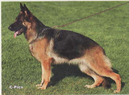
*Gwyneth vom Amur, 2218313, Z: Daniela Kötters, 46354 Oeding, E: Budiman Salihin, 58300 Wetter, Halter: Heiner Honerlage, 33335 Gütersloh

4 *Chiara vom Kirchturm, SZ 2212734, X-B 2121, SchH3 , WT 10.01.2008 (*Valdo von den Hugenotten, SZ 2158133, SchH3 - *Bibi vom Kirchturm, SZ 2156435, SchH2) HD normal, DNA gpr., ED normal, HD-Zuchtwert 86. Chiara ist eine große, mittelkräftige, sehr typ- und ausdrucksvolle Hündin mit sehr guter Pigmentierung. Sie zeigt hohen langen Widerrist und einen festen geraden Rücken, an den sich eine Kruppe von sehr guter Länge und Lage anschließt. In Vor- und Hinterhand ist sie sehr gut gewinkelt. Bei korrekter Vorbrust sollte die Unterbrust etwas länger sein, die Front ist korrekt. Gerade tretend zeigt sie sehr gute kraftvolle Gänge, wobei sie sich in der Freifolge noch etwas steigern sollte, was eine noch bessere Platzierung rechtfertigen würde. Chiara konnte mich während der Saison positiv überzeugen.