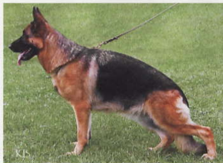
*Tamara v. Haus Christa, 2241365, Z: Zsolt Biro, H-1204 Budapest, E: Setty Nagraj, IN-4000072 Mubai

2 *Connie de la P'tite Flore, SZ 2236209, 2FKU741, SchH2, WT 04.08.2007 (*Vegas du Haut Mansard, SZ 2164725, SchH3 - *Saraby du Mont D'Anubis, LOF 540116, SchH1) HD normal, DNA gpr., ED fast normal, HD-Zuchtwert 83. Große, kräftige, sehr typvolle, in gutem Gebäudeverhältnis aufgebaute Hündin. Sie ist trocken und fest, hat einen kräftigen Kopf, hohen Widerrist, festen Rücken und eine lange, gut gelagerte Kruppe. Die Vorhand ist gut, die Hinterhand ist sehr gut gewinkelt. Sie hat ausgeglichene Brustverhältnisse und eine korrekte Front. Hinten eng, vorne geradetrete zeigt sie bei kraftvollem Nachschub freien Vortritt mit sehr gutem Raumgewinn. Während der Gangwerksprobe sollte sich die Hündin phasenweise etwas frischer präsentieren.