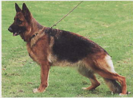
*Leila vom Drei Birkenzwinger, 2210912, Z: Hans Karl, 66386 St. Ingbert, E: Züchter und Reinhard Engel, 49545 Tecklenburg, Halter: Hans Karl, 66386 St. Ingbert

20 *Leila vom Drei Birkenzwinger, SZ 2210912, I-A 8354, SchH3, WT 16.10.2007 (*Merlin vom Osterberger-Land, SZ 2142032, SchH3 - *Farina vom Drei Birkenzwinger, SZ 2141761, SchH1) HD fast normal, DNA gpr., ED fast normal, HD-Zuchtwert 94. Groß, mittelkräftig, typ- und ausdrucksvoll, trocken und fest und in gutem Verhältnis aufgebaut. Die Hündin hat hohen Widerrist, geraden Rücken, die Kruppe sollte bei guter Lage länger sein. Der lange Oberarm sollte schräger liegen, die Hinterhand ist sehr gut gewinkelt. Hinten leicht hackeneng, vorne gerade tretend zeigt sie bei kraftvollem Nachschub freien Vortritt mit viel Raumgewinn.