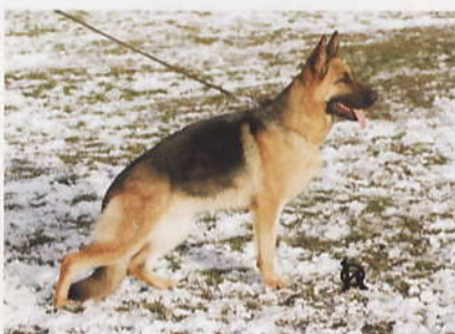
VD10, Kora Rumina Moravia , 18. 9. 2002, 46818/02, 89214, 0/0, ZVV1, (Nicko Hartis Bohemia – Fanta Rumina Moravia).

Středně vysoká, středně silná, velmi dobrého typu, správný kohoutek, plynulá hřbetní linie, dobře položená zád by měla být prostornější, korektní hrudník, vpředu dobře, vzadu velmi dobře zaúhlena, živé chody s dobrým vykročením a odpovídajícím posunem.