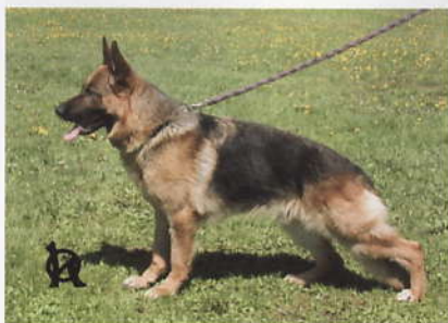
V21, Cháris Kuver , 17. 2. 2001, 41474/01/02, 45651, 0/0, ZVV1, (Mack v. Aducht – Bessy Kuver).

Velký, středně silný, správný výraz, typický otec, harmonická linie, vrchní a spodní, pevný hřbet, správně položená záď, velmi dobré úhlení, vykročení dobré, pes by se měl lépe předvádět, uši by měly být pevnější, (výrazně, nepouští).