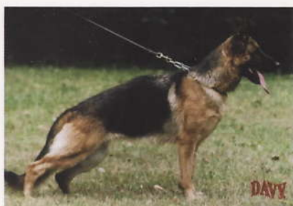
V3, Kessy z Agíru Bohemia , 8. 12. 2001, 44202/01, 55505, fast normal, ZVV1, (Wallace a. Agrigento – Alice Aranyvölgyi – Örség).

Středně velká, středně silná, ve velmi dobré kondici, dobrá hlava, dobrá linie hřbetu, dobré zaúhlení vpředu, velmi dobré vzadu, rovná fronta, korektní poměry hrudníku, rovný nášlap, velmi dobré chody, (výrazně, pouští).