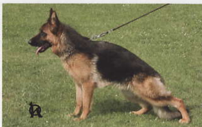
VD13, Ilka Ornis-Bohemia , 13. 2. 2003, 48246/03, 49960, (Apoll Hartis Bohemia – Kelly Ornis-Bohemia).

Středně vysoká, středně silná, dobrá hlava, poněkud delší ucho, správný kohoutek, plynulá hřbetní linie, dobře položená zád, úhlení končetin velmi dobré, vykročení by mělo být volnější, správný posun, volná hlezna.