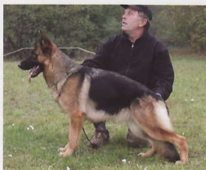
s dobrým vykročením a dobrým posunem.

Středně vysoká, středně silná, ušlechtilá, velmi dobrého typu, výrazný kohoutek, plynulá hřbetní linie, zád' dobře položena, korektní hrudník a fronta, oboustranně velmi dobře zaúhlená, fena vykazuje živé a prostorné chody při celkové pevnosti.