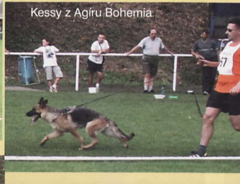
Kessy z Agiru Bohemia