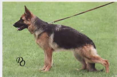
VD6, Flinta Gard Bohemia , 11. 9. 2002, 46766/02, 58016, 0/1, (Kanes Dany květ – Anita z Agíru Bohemia).

Středně vysoká, středně silná, velmi dobře pigmentovaná, typická fena, výrazný kohoutek, pěkná hřbetní linie, dobře položená zád' by měla být prostornější, úhlení končetin velmi dobré, výrazné předhrudí, chody správné, živé.