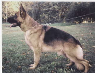
V10, Vax Framato Rolau, 5. 2. 2000, 38346/00/03, 23337, a-normal, IPO1, SchH1, (Murray Framato Rolau – Mona v. Fossheller).

Středně velký, středně silný, správný formát, velmi dobrá pigmentace, výrazný, dobrý kohoutek, pevný hřbet dobře položená záď, která by měla být o něco delší, rameno by mělo být šikměji položeno, velmi dobré zadní úhlení, rovná fronta, dobré vykročení, posun by měl být vydatnější, jinak pes vykazuje živé chody, (výrazně, pouští).