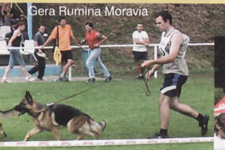
Gera Rumina Moravia