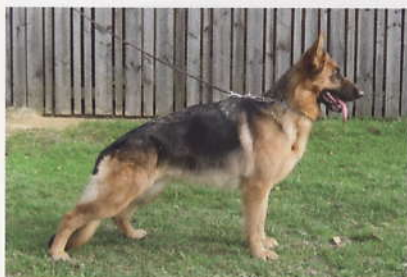
VD9, Quana Avax Hof , 29. 1. 2003, 48100/03, 56659, normal, (Fritz v. Farbenspiel – Xena Avax CS).

houtek, plynulá hřbetní linie, dobře položená mírně kratší zád, vpředu dobře, vzadu velmi dobře zaúhlena, postoj pánevních uší, dobré vykročení, správný posun.