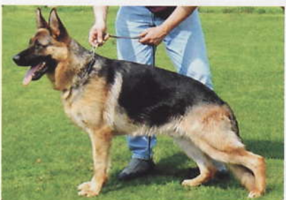
V4, Navolino Avax Hof, 30. 7. 2002, 46430/02/04, 56608, normal, ZVV1, (Ando v. Altenberger Land – Zimba Avax).

Středně velký, středně silný, správné délky, velmi dobře pigmentovaný, výrazný, pevný, vysoký kohoutek, pevný hřbet, dlouhá záď s menším sklonem, velmi dobře úhlený, rovná fronta, temperamentní chody s dobrou délkou, lokty by se měly ještě uzavřít, (výrazně, pouští).