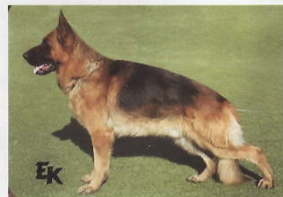
V1, Flash Avax Hof , 27. 7. 2000, 38887/00, 38887, A, SVV1, (Dux della Valcuvia – Xena Avax).

Středně silný, středně velký, vysoký, dobře pigmentovaný s dobrým výrazem, výrazná hlava, výrazný kohoutek, dobře položená záď, dobře vpředu i vzadu úhlený, správný posun končetin, dobře formovaný hrudník, temperamentní, dobré chody, vykročení vpředu by mělo být vydatnější, dobře se prezentuje, (výrazně, pouští).