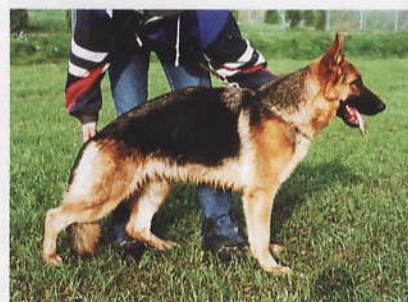
V12, Indy Jam Fabare Bohemia , 10. 12. 2000, 40896/00/02, 88363, A, ZVV1, SchH1, ZOP, BH, (Strauss d'Ulmental – Alyn Fabare Bohemia).

Středně velká, silná, pevné stavby těla, širěji nasazené ucho, rovný kohoutek, zvýšená linie hřbetu, záď krátká a spádité, dobré zaúhlení vpředu a vzadu, rovná fronta, dostatečné poměry hrudníku, rovný nášlap, dobré chody, při pohybu snížený předek, (výrazně, pouští).