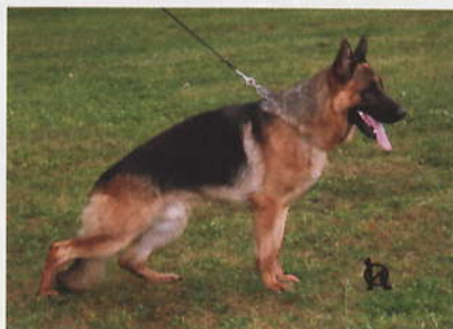
VD4, Xaron Hartis Bohemia , 10. 11. 2002, 47167/02, 89217, (Saber v. Steffen Haus – Merry Hartis Bohemia).

Vysoký, středně silný, dobře pigmentovaný, typický pes, výrazný kohoutek, pěkná hřbetní linie, dobře položená zád', mírně kratší, dobrý hrudník, korektní fronta, vpředu dobře, vzadu velmi dobře úhlen, dobré vykročení, vydatný posun.