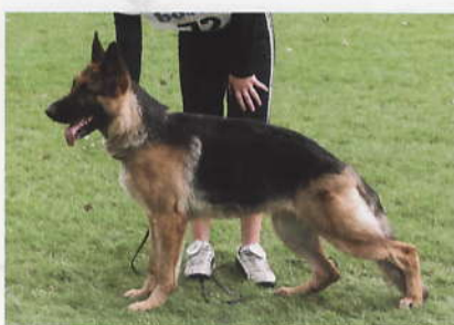
V5, Nala v. d. Reck-Kamensche Heide , 4. 9. 2001, 2090308, F-G 4677, normal, SchH3, (Ilk v. d. Reck-Kamensche Heide – Zita v. Ramona).

Středně velká, středně silná, typická a výrazná, dobrá hlava, normální kohoutek, dobrá linie hřbetu, záď by měla být delší. Rameno je strmé, velmi dobře zaúhlená vzadu, rovná fronta, poměr délky k hrudníku správný, rovný nášlap, dobrý záběr zadních končetin, předkrok by měl být delší, (výrazně, pouští).