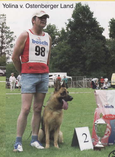
Yolina v. Ostenberger Land