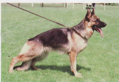
VD2, Indy Dřhá Roveň , 13. 9. 2002, 43607/02, 43607, negativní, SVV1, (Dux della Valcuvia – Nela Dřhá Roveň).

Vysoká, středně silná, typická fena, výrazný kohoutek, pěkná hřbetní linie, dobře položená mírně kratší zád', vpředu dobře, vzadu velmi dobře zaúhlená, dobré vykročení, výrazný posun.