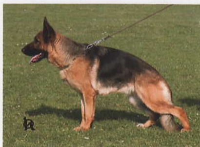
VA3, Kira Hartis Bohemia , 25. 4. 2001, 42193, 89136, 0/0, ZVV1, (Maik del Gobbo – Queen Hartis CS).

Velká, silná, velmi dobrého výrazu, silná hlava, vysoký kohoutek, pevný hřbet, dobré uložení zádě, dobře zaúhlená vpředu, velmi dobře vzadu, rovná fronta, normální poměry hrudníku, rovný nášlap, velmi dobré chody, (dobře, pouští).