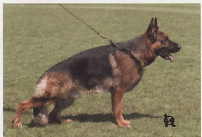
R. CAC, VA2, Apoll Hartis Bohemia , 12. 5. 2000, 39178/00/02, 43400,

Velký, silný, velmi dobrý objem, harmonická vrchní i spodní linie, výrazná silná hlava, velmi pěkná pigmentace, vysoký kohoutek, správně položená záď, dobré délky, velmi dobré úhlení vpředu i vzadu, korektní fronta, pes vykazuje živé chody s dobrým vykročením a vydatným posunem a pevným hřbetem, (výrazně, pouští).