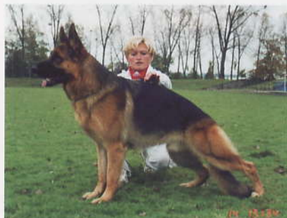
V12, Daymon z Lintichu , 6. 2. 2001, 45490-021, 40165, 0/0, SchH2, (Till v. Lechtal – Roxy z Lintichu).

Velký, středně silný, velmi dobré stavby, velmi dobrý pigment, silná hlava, výrazná, harmonická linie vrchní tak spodní, výrazný kohoutek, pevný hřbet, dlouhá výrazná záď, velmi dobré linie, rovné chody, přední lopatka by měla být více dopředu položená, dobré chody s dobrým nesením hřbetní linie, (výrazně, pouští).