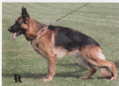
V6, Cerro Hartis Bohemia, 17. 9. 2000, 40445/00/02, 46423, negativní, ZVV1, SchH2, ZPO1, ZOP, (Torro Hartis – Linda Hartis).

Středně velký, středně silný, správná výška, velmi dobře pigmentovaný, výrazná hlava, pevný hřbet, dobře položená záď, rovné chody, pes vykazuje živé chody s prostorným vykročením a vydatným posunem, (výrazně, pouští).