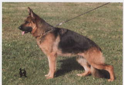
VD15, Dora Dolmina , 15. 8. 2002, 46624/02/04, 49913, 0/1, ZVV1, (Nicko Hartis Bohemia – Queen Dolmina).

Středně vysoká, dobře pigmentovaná, správný kohoutek, plynulá hřbetní linie, dobře položená, mírně kratší zád, vpředu dobře, vzadu velmi dobře úhlena, ne zcela pevné hlezno.