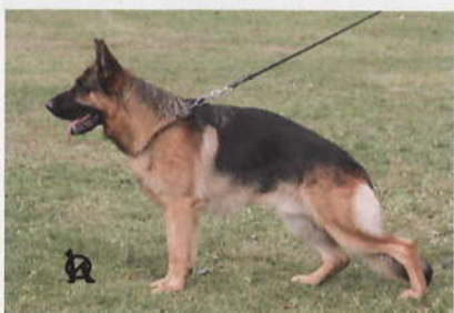
V17, Orkan Xitaxis , 15. 5. 2001, 42243/01/03, 58702, 0/1, ZVV1, IPO1, (Miko v. Alexyrvo Hof – Xinia Vitaxis).

Středně velký, středně silný, dobrá silná kostra, silný formát, šíře nasazené uši, normální kohoutek, pevný hřbet, dostatečně dlouhá záď, dobře úhlený vpředu i vzadu, spodní linie by měla být delší, temperamentní, vydatné chody, lokty by měly být více uzavřeny, (výrazně, nepouští).