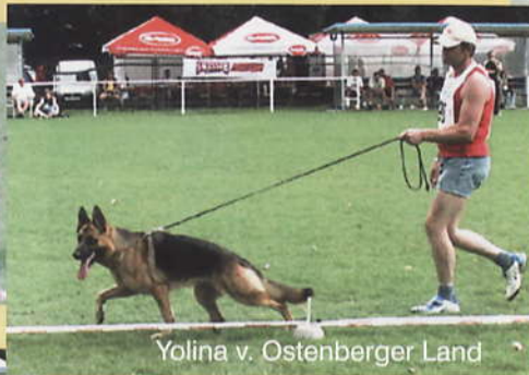
Yolina v. Ostenberger Land