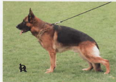
V9, Bad Vi-kar, 12. 1999, 35446/99/02, 87057, fast normal, SchH1, ZVV1, (Torro Hartis – Nicca Krásnoočko).

Velký, středně silný, silná hlava, o něco větší uši, slabý kohoutek, dobře položená záď, dobře vpředu a velmi dobře vzadu úhlený, rovné chody, dobrý posun, vpředu by mohl být o něco silnější a měl by mít pevnější ucho, (výrazně, pouští).