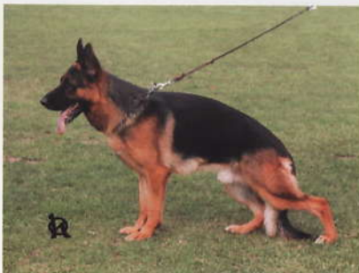
V11, Kirr Hartis Bohemia, 25. 4. 2001, 42192/01/03, 89135, 0/0, SchH3, (Maik del Gobbo – Queen Hartis).

Středně velký, středně silný, silná hlava, dobrý kohoutek, pevný hřbet, dobře položená, ale krátká záď, hluboký hrudník, dobré přední a velmi dobré zadní úhlení, dobré chody, ale vpředu by měl vykazovat chody delší, (výrazně, nepouští).