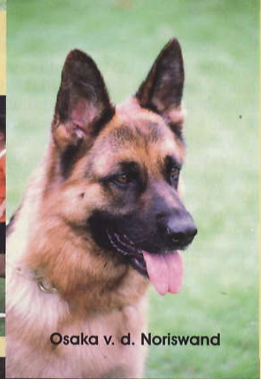
Osaka v. d. Noriswand