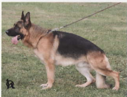
V7, Warry Ornis Bohemia, 25. 6. 2001, 49810, 0/0, ZOP, ZM, ZVV1, (Quero Hartis – Rommi Ornis).

Středně velký, středně silný, správný poměr výšky k délce, správný výraz, silná hlava, velmi dobré úhlení, dobře položená záď, korektní fronta, dobré chody, ale zadní záběr by měl být silnější, (výrazně, pouští).