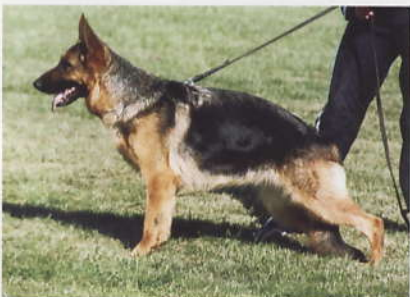
VD11, Cedra Irluka , 19. 1. 2003, 48055/03, 86849, (Untox v. Ducati – Nara Irluka).

Vysoká fena, velmi dobrého typu, správný kohoutek, pěkná horní linie, dobře položená mírně kratší zád, vpředu dobře, vzadu velmi dobře úhlena, vykročení dobré, velmi dobrý posun.