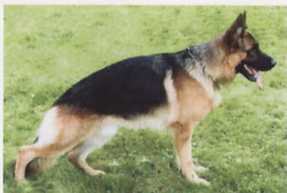
V13, Jyro z Kyjovského údolí , 13. 3. 2002, 45308/02/04, 29394, 0/0, ZVV1, (Esko v. Dänischen Hof – Xenii v. Mönchberg).

Velký, silný, správný formát, dobrá hlava, pevný hřbet, výrazný kohoutek, správně položená záď dobré délky, správné úhlení, dobrá hloubka, dobré vykročení, posun by měl být vydatnější, (dobře, pouští).