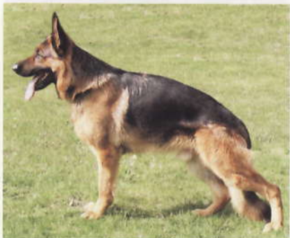
V3, Ajax z Arnulovic, 4. 4. 2001, 4205601/04, 29356, normal, SchH1, (Don di Casa Nobili – Holly v. Feuerturn).

Středně velký, středně silný, korektní výraz, silná hlava, pěkný výraz, harmonická horní i spodní linie, výrazný kohoutek, pevný hřbet, správně položená záď dobré délky, velmi dobré úhlení, rovná fronta, korektní fronta, velmi dobré chody při dobrém přenášení hřbetu, (dobře, pouští).