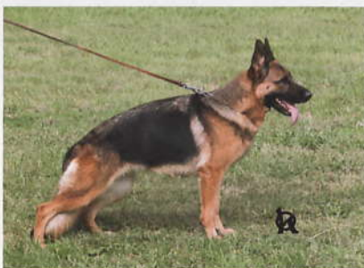
V9, Gera Rumina Moravia , 5. 6. 2000, 39625/00/03, 89101, 0/0, ZVV1, (Quero Hartis CS – Fanta Rumina Moravia).

Velká, silná, dobré stavby těla, širěji nasazené ucho, normální kohoutek, pevný hřbet, krátká záď, strměji uložená lopatka, velmi dobře zaúhlená vzadu, rovná fronta, korektní poměr hrudníku, rovný nášlap, při silném záběru zadních končetin by měl být vydatnější předkrok, (dobře, pouští).