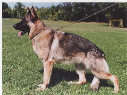
V8, Tesi Vitaxis , 5. 12. 2001, 44158/01/03, 58846, 0/2, ZVV1, ZZO, (Timo v. Berrekasten – Xinia Xitaxis).

Středně velká, silná, delšího formátu, dobrá hlava, normální kohoutek, pevný hřbet, dobře uložená záď, dobře zaúhlená vpředu, velmi dobře vzadu, rovná fronta, korektní poměry hrudníku, rovný nášlap, lokty málo pevné, dobré chody, (výrazně, pouští).