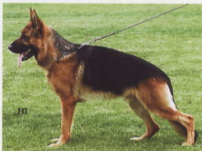
Vítěz třídy, VD1, Santos v. d. Jahnhöhe , 5. 10. 2002, 2116877, R-E 6798, fast normal, (Bax v. d. Luisenstrasse – Rimona v. d. Noriswand).

Vysoký, výrazný pes, s výrazným kohoutkem a dobrou silou kostí, výrazný kohoutek, plynulá hřbetní linie, zád' dobré polohy, fronta normální, oboustranně velmi dobré zaúhlení, chodí živě, s dobrým výkrokem a vydatným posunem.