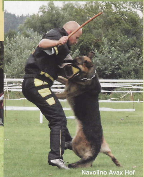
Navolino Avax Hof