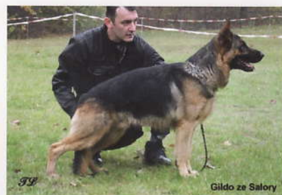
V18, Gildo ze Salory , 3. 7. 2002, 46328/02, 32914, 0/0, ZVV1, (Natz v. Moorbeck – Yossi Vitaxis).

Velký, silný, výrazný, dobrý kohoutek, pevný hřbet, dobře položená záď, rovné chody, dobře vpředu a velmi dobře vzadu úhlený, lokty by měly být uzavřenější, dobré vykročení, posun by měl být výraznější, (výrazně, pouští).