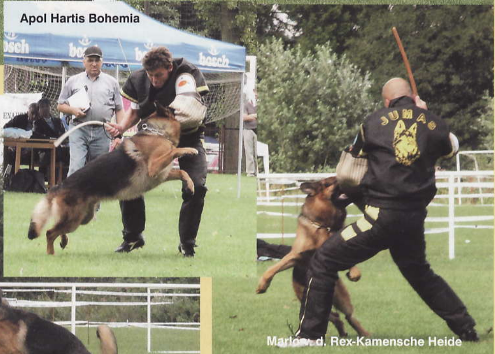
Marlow d. Rex-Kamensche Heide