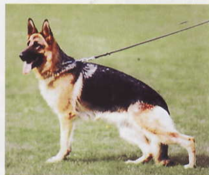
VD7, Frea Schreidon , 28. 1. 2003, 2073197, 58121, (Arak v. Frankengold – Utty Framato Rolau).

Středně vysoká, středně silná, velmi dobrého typu, správný kohoutek, plynulá hřbetní linie, dobře položená zád' by měla být prostornější, úhlení končetin oboustranně velmi dobré, chody odpovídají úhlení.