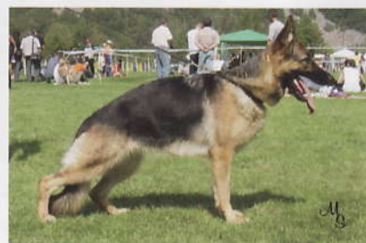
mírně kratší zád', úhlení končetin velmi dobré, při dobrém vykročení správný posun, živé chody.