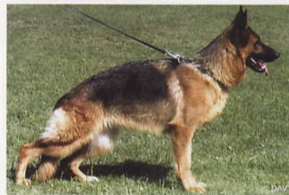
V1, Sara z Folinku , 26. 9. 2001, 43637/01/03, 67476, 1/0, ZVV1, (Valium v. Arminius – Betty z Hrabství Danpi).

Středně velká, středně silná, pevné stavby těla, dobrá linie hřbetu, a hrudníku, dobré uložení zádě, dobře zaúhlená vpředu, velmi dobře vzadu, rovná fronta, velmi dobré poměry hrudníku, vpředu užší nášlap, vzadu rovný, při dobrém záběru zadních končetin by měl být volnější předkrok, (výrazně, pouští).