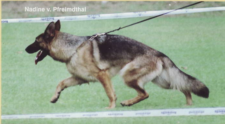
Nadine v. Pfreimdthal

Středně silná, celočerná fena, dobrého výrazu, kohoutek málo výrazný, rovný pevný hřbet, dobře položená kratší záď, kost by měla být delší a šikměji položena, vzadu těsně velmi dobře úhlena, akce končetin méně prostorná.