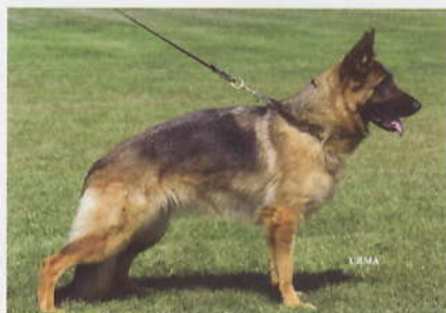
Vítěz třídy, VD1, Nadine v. Pfreimd , 20. 9. 2002, 2112710, P-K 7130, (Cim v. d. Piste Trophe – Anschie v. d. Piste Trophe).

Počet přihlášených 33, posouzeno při statické 31 jedinců, tj. téměř 94 % z přihlášených. Počet posouzených odpovídá průměru let minulých. Druhý den jedna fena odstoupila a na závěr dospělo 30 fen. Všechny obdržely známku velmi dobrá. Také tato třída byla velmi dobře kvalitativně obsazena. Feny seřazené po statickém posouzení tyto pozice při zkoušce v pohybu až na malé výjimky obhájily. Feny, které obsadily přední místa, jsou velmi dobrými představitelkami plemene, správných tělesných poměrů a velmi dobré mechaniky pohybu. Taktéž zde je na místě poděkovat majitelům a vodičům za korektní vystupování a správnou přípravu, kterou svým fenám věnovali. Do budoucna jim přeji hodně úspěchů i ve třídě pracovní.