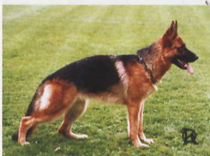
V4, Ambra Dollby Bohemia , 26. 11. 2000, 40868/00/02, 58617, 0/0, ZVV1, (Sirk v. Wildsteiger Land – Messie Irluka).

Středně velká, středně silná, ve velmi dobré kondici, dobrá hlava, dobrá linie hřbetu, dobré zaúhlení vpředu, velmi dobré vzadu, rovná fronta, korektní poměry hrudníku, rovný nášlap, velmi dobré chody, (výrazně, pouští).