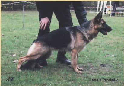
Hartis Bohemia – Kora Benátská vini- ce).

Středně vysoká, středně silná, ucho šířeji nasazené; normální kohoutek, plynulá hřbetní linie, záď poněkud kratší, vzpředu dobře, vzadu velmi dobře úhlena, vykročení dobré, posun velmi dobrý.