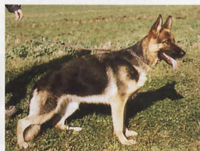
V2, Arina z Hanýžkovic , 3. 3. 2002, 45099/02/03, 72378, 0/1, ZVV1, (Irkor v. Wildsteiger Land – Noris Irluka).

Středně velká, středně silná, typická a výrazná, velmi dobré stavby těla, vysoký kohoutek, lehce klenutý hřbet, zád by měla být delší, velmi dobré zaúhlení, rovná fronta, správné poměry hrudníku, rovný nášlap, velmi dobré chody, 2x P1 vpravo nahoře, (výrazně, nepouští).