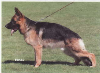
V2, Dax z Lipé Moravia, 17. 4. 2002, 45387/02/04, 72379, normal, ZVV1, (Uran v. Moorbeck – Tani z Lipé).

hřbet, rovný hřbet, dobře položená záď dobré délky, rovné chody, dobře formovaný hrudník, dobré chody, ale posun by měl být vydatnější, (dobře, pouští).