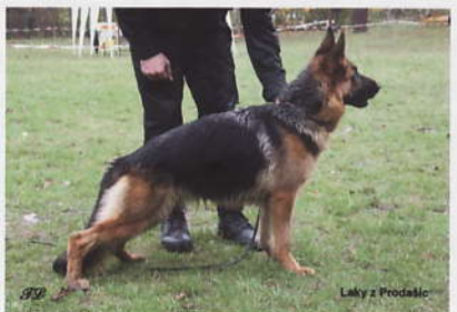
VD16, Laky z Prodašic , 26. 8. 2002, 46719/02, 12997, (Apoll Hartis Bohemia – Kora Benátská vinice).

Středně silná, dobře pigmentovaná, správný typ, normální kohoutek, pevný hřbet, normální zád, vpředu dobře, vzadu velmi dobře zaúhlena, fena chodí živě s dobrým vykročením a výrazným posunem.