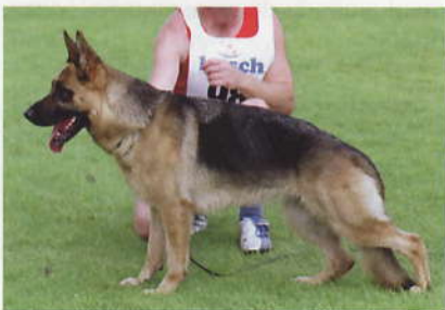
VA2, r. CAC Yollina v. Osterberger-Land , 12. 1. 2002, 2097651, D-F 0944, normal, SchH3, (Ghandi v. Arlett – Clea v. Osterberger-Land).

Středně velká, středně silná, typická a výrazná, velmi dobrá hlava, normální kohoutek, dobré uložení zádě, která by měla být delší, velmi dobré zaúhlení, vpředu i vzadu, rovná fronta, dobré poměry hrudníku, rovný nášlap, velmi dobré chody, (dobře, nepouští).