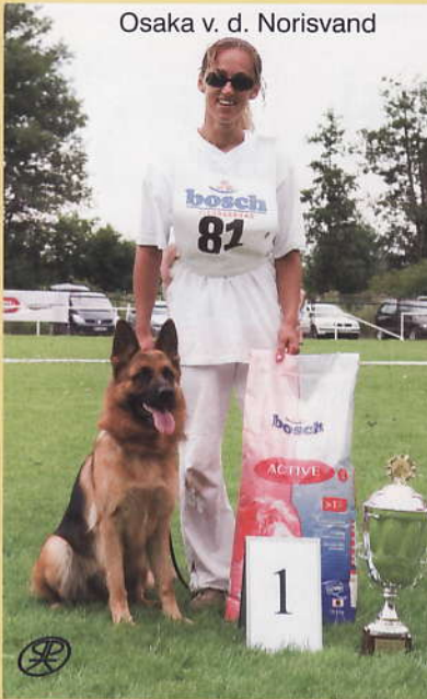
Osaka v. d. Norisvand