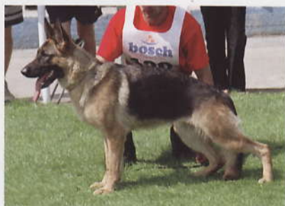
VD4, Bety z Hanýžkovic , 9. 9. 2002, 46657/02/04, 72384, /, ZVV1, (Kimon v. Pfälzer – Hof – Noris Irluka).

Středně vysoká, středně silná, velmi dobrého typu, správný kohoutek, plynulá hřbetní linie, dobře položená zád' by měla být prostornější, úhlení končetin oboustranně velmi dobré, chody odpovídají úhlení.