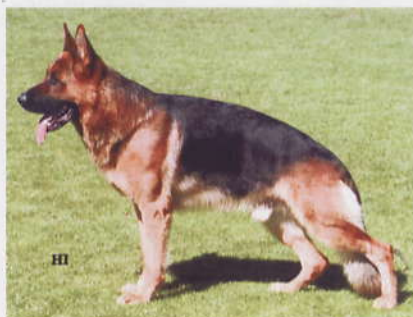
Klubový vítěz, VA1, CAC, Janos v. d. Noriswand , 24. 8. 2001, 2090082, RE 6597, normal, SchH3, (Yasko v. Farbenspiel – Rimona v. d. Noriswand).

Velký, silný, velmi dobrý objem, harmonická vrchní i spodní linie, výrazná silná hlava, velmi pěkná pigmentace, vysoký kohoutek, správně položená záď, dobré délky, velmi dobré úhlení vpředu i vzadu, korektní fronta, pes vykazuje živé chody s dobrým vykročením a vydatným posunem a pevným hřbetem, (výrazně, pouští).