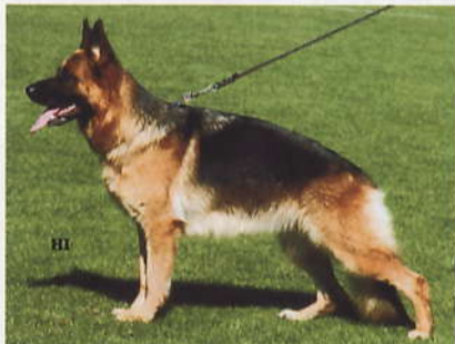
VA1, CAC Osaca v. d. Noriswand , 27. 7. 2002, 2109016, R-E 6759, fast normal, SchH2, (Erasmus v. Noort – Clia v. d. Noriswand).

Středně velká, středně silná, typická a výrazná, velmi dobrá hlava, normální kohoutek, dobré uložení zádě, která by měla být delší, velmi dobré zaúhlení, vpředu i vzadu, rovná fronta, dobré poměry hrudníku, rovný nášlap, velmi dobré chody, (dobře, nepouští).