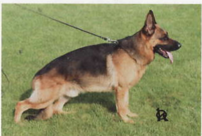
V14, Nicko Hartis Bohemia , 2. 4. 1999, 36936/99/01, 43319, 0/0, IPO1, (Valium v. Arminius – Palme Orniss).

Středně velký, středně silný, korektní formát, výrazná hlava, normální kohoutek, dobře položená záď by měla být delší, dobře vpředu a velmi dobře vzadu úhlený, normální fronta, temperamentní s dobrým vykročením, ale posun by měl být vydatnější, (výrazně, nepouští).