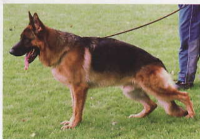
VD2, Pan v. Team Fiemereck , 31. 12. 2002, 2119624, P-E 4994, (Quando v. Sofienwald - Tina v. Poxdorfer Tannehof).

Vysoký, výrazný pes, s výrazným kohoutkem a dobrou silou kostí, výrazný kohoutek, plynulá hřbetní linie, zád' dobré polohy, fronta normální, oboustranně velmi dobré zaúhlení, chodí živě, s dobrým výkrokem a vydatným posunem.