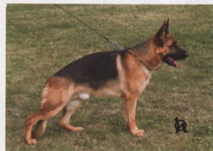
VD6, Qwirius Manepo Ideál , 24. 12. 2002, 47674/02, 43517, (Canto di Casa Massarelli – Megy Manepo Ideál).

rým výkrokem a výrazným posunem, lokty ne zcela pevné.