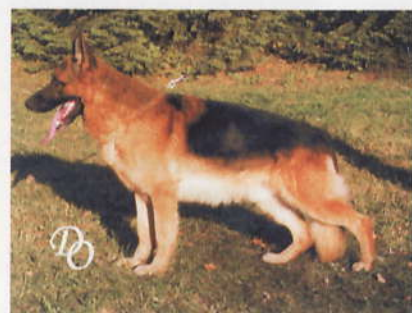
V19, Hasko v. Fürstenberg , 17. 9. 1999, SZ-2050853, F-R-4126, 0/0, ZVV1, (Jango v. Fürstenberg – Rike v. Ramone).

Středně velký, středně silný, správný výraz, dobrá pigmentace, normální linie, dobrý kohoutek, pevný hřbet s dobrou zádi o něco šikměji položené, střední chody by měly být korektnější, pes vykazuje dobré vykročení, měl by se lépe prezentovat, (výrazně, pouští).