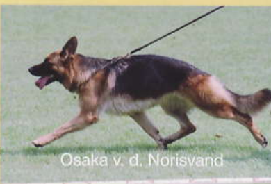
Osaka v. d. Norisvand