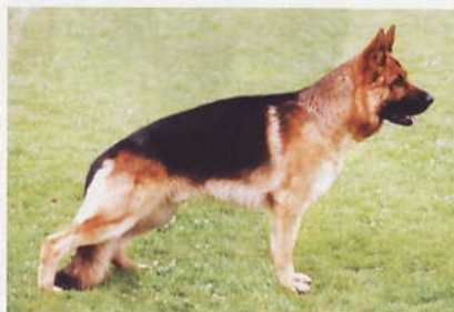
V15, Kimon Orniss-Bohemia , 22. 6. 1999, 36884/99/01, 49699, 1/1, SchH1, ZVV1, (Boccaccio v. d. Wienerau – Pamela Orniss).

ka, velmi dobré linie, normální chody, temperamentní, dobrá prezentace, (výrazně, pouští).