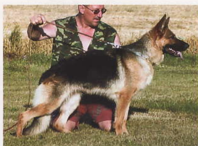
SchH A ZVV1, (Vantor v. Batu – Cony Danyl CS).

Středně velká, středně silná, dobrý výraz, silná hlava, vysoký kohoutek, pevný hřbet, lehce spádité záď, velmi dobré zaúhlení, rovná fronta, mělký hrudník, vpředu a vzadu rovný nášlap, (výrazně, pouští).