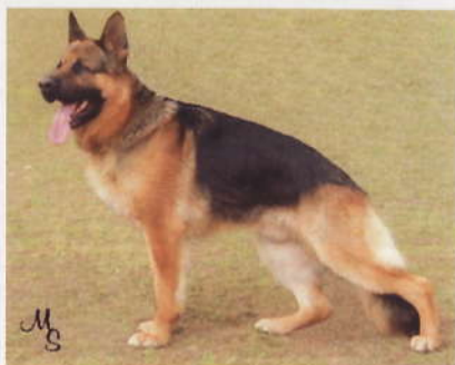
V16, Kanes Dany květ , 1. 1. 2000, 38319/00/02, 58516, 0/0, ZVV1, (Neptun v. Bad-Boll – Jany Dany květ).

Středně velký, silný, silná hlava, výrazná, pevný hřbet, dobře položená záď správné délky, dobře vpředu a velmi dobře vzadu úhlený, dobré chody, ale lokty by měly být více uzavřené, (dobře, pouští).