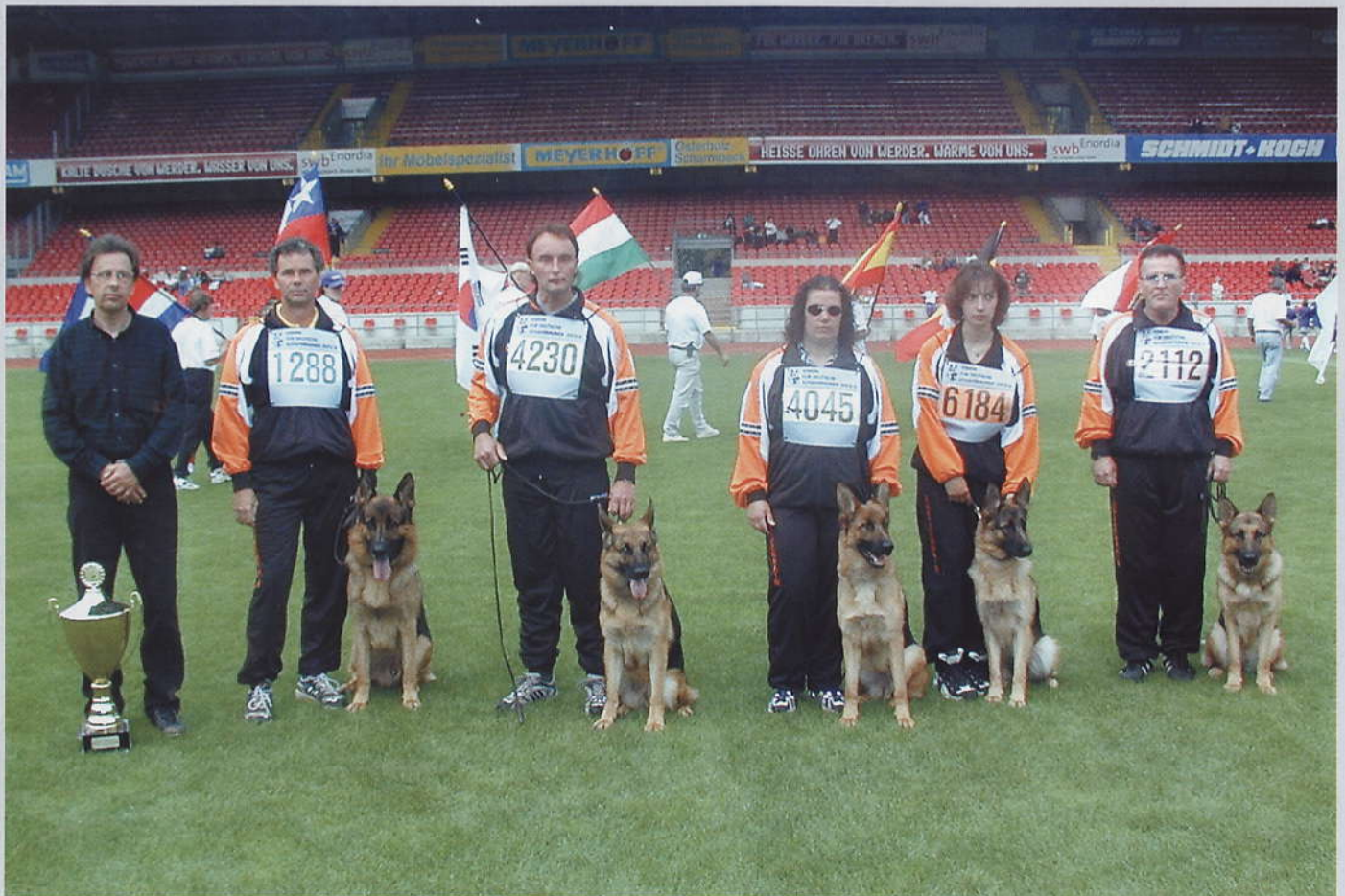
Zuchtgruppensieger 2000 Zwinger von Lärchenhain